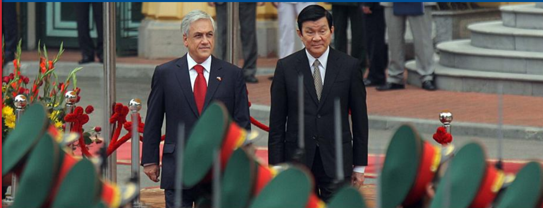
Visita Presidencial Vietnam