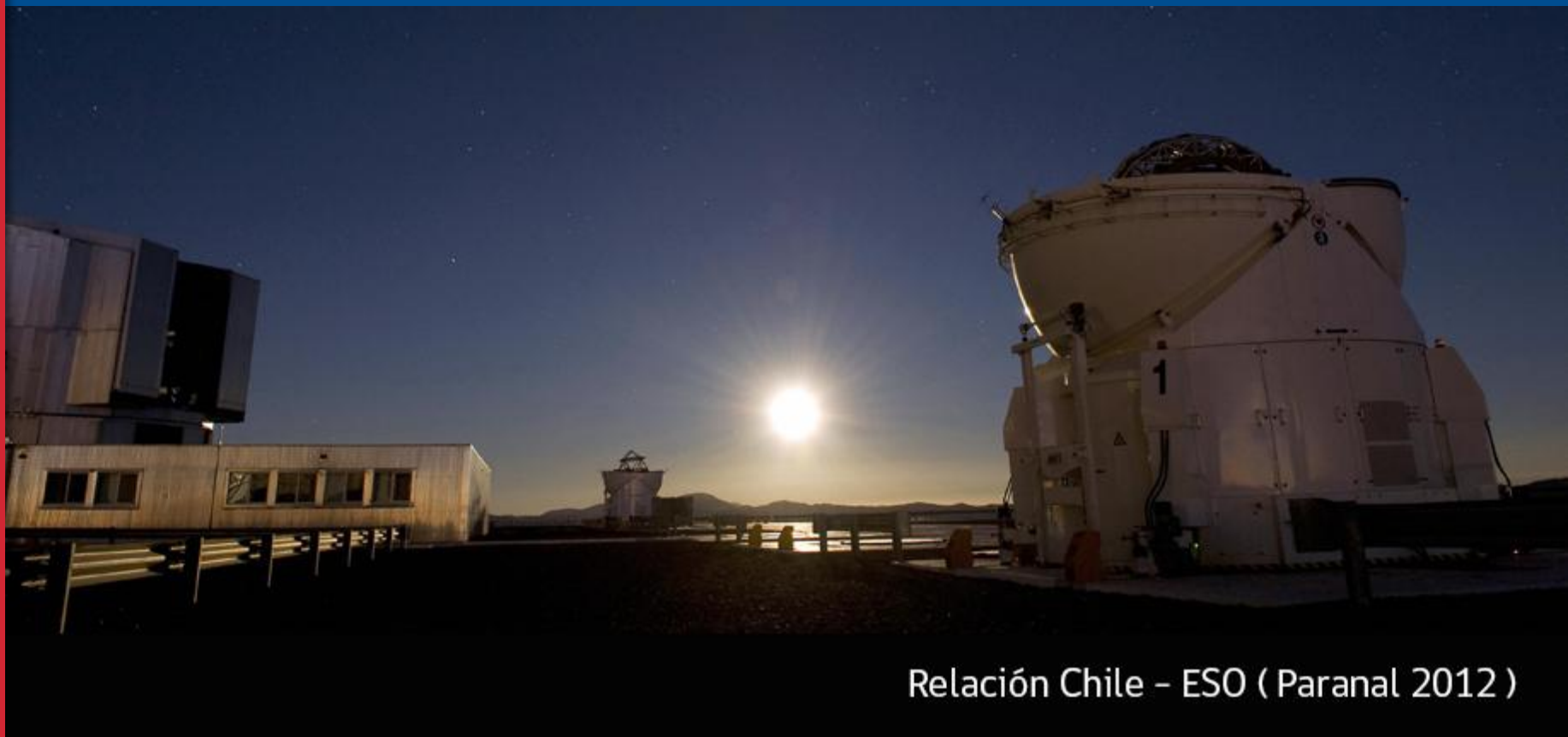
Relación Chile - ESO ( Paranal 2012 )