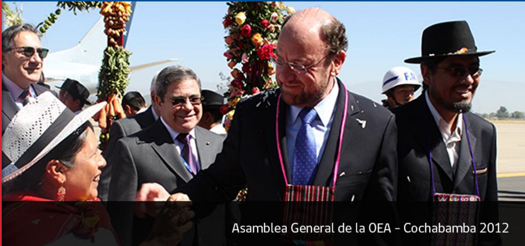
Asamblea General de la OEA – Cochabamba 2012