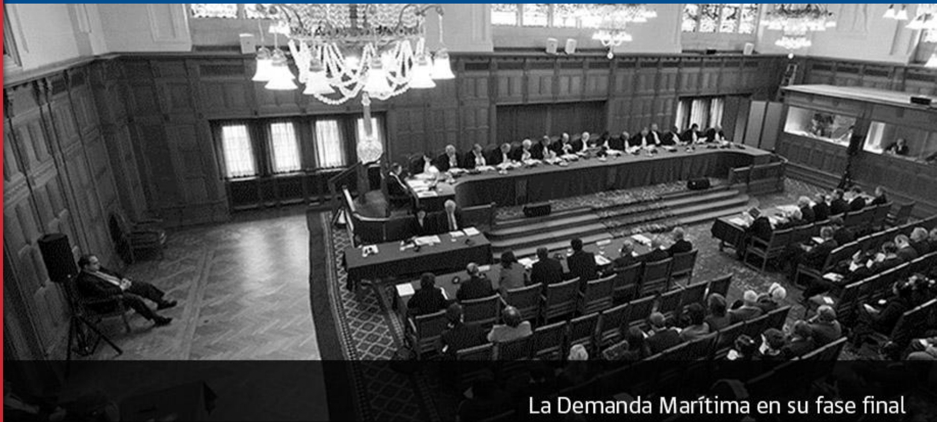
La Demanda Marítima en su fase final