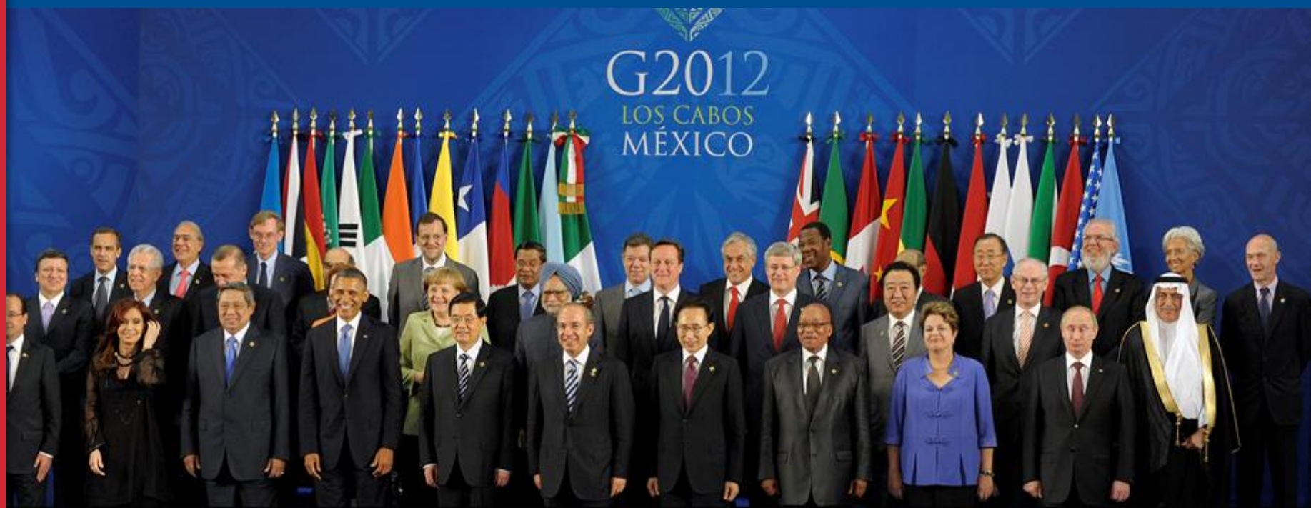
Cumbre de Líderes G - 20