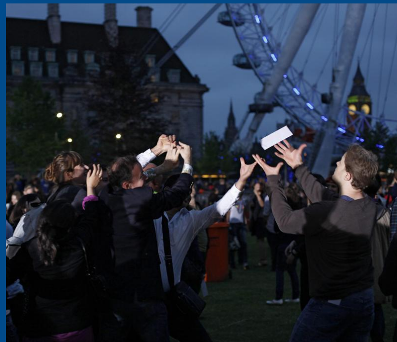
Lluvia de Poemas – Londres, 2012