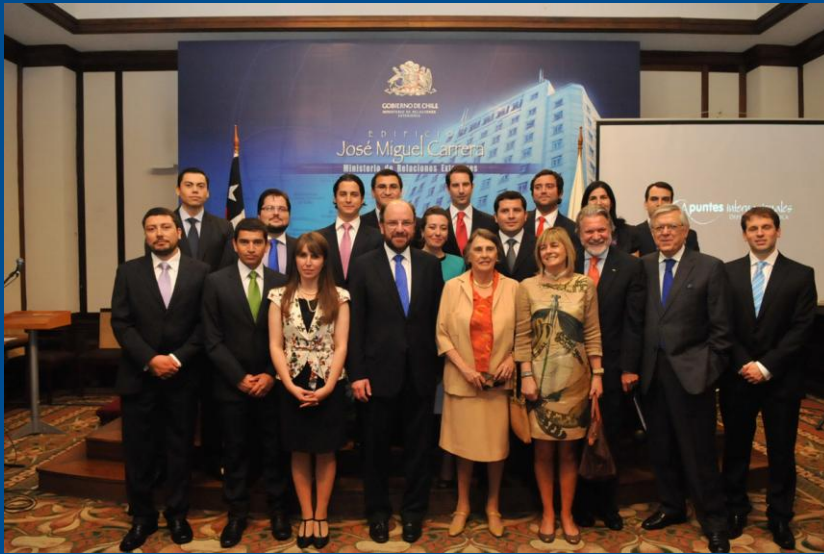
Graduación Academia Diplomática 2012