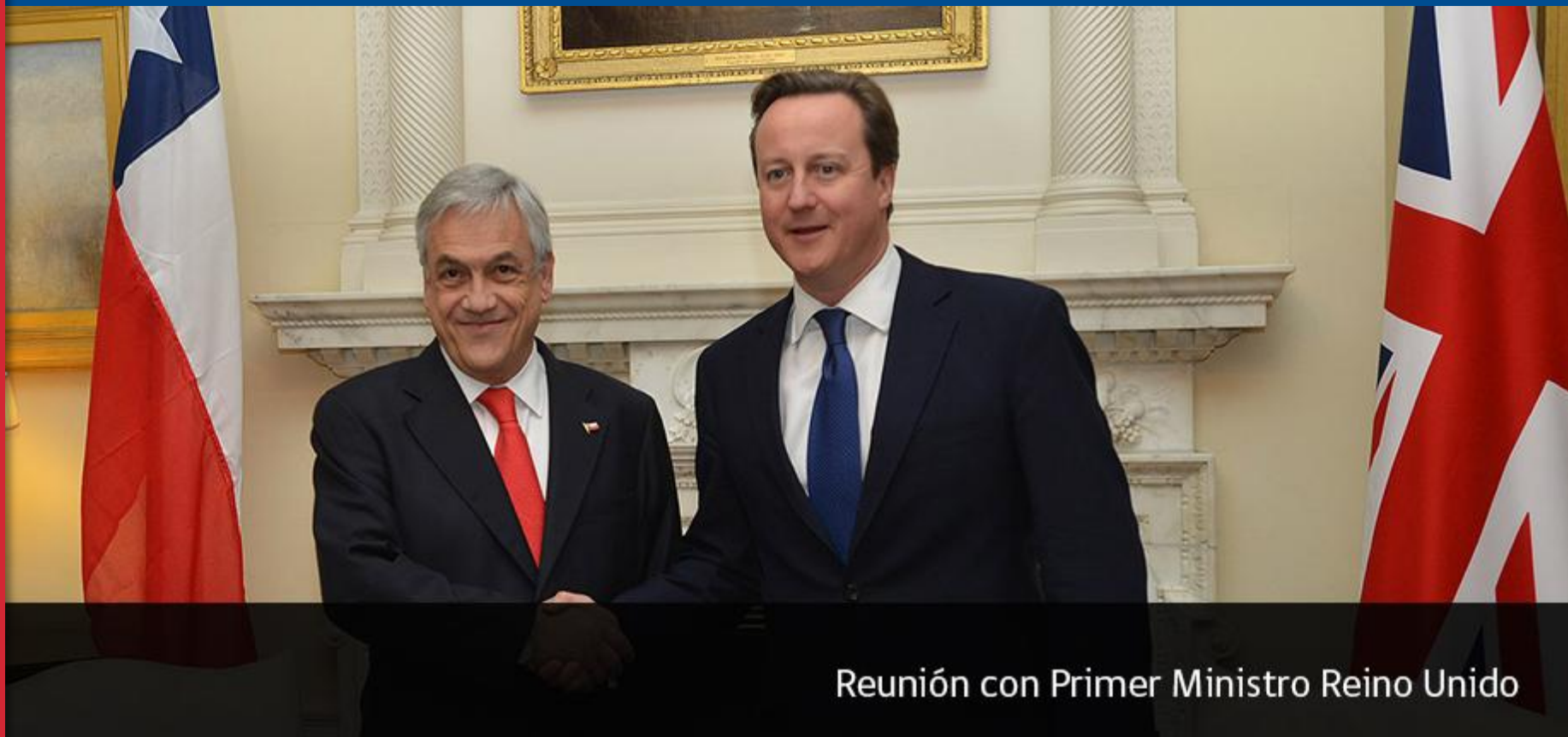
Reunión con Primer Ministro Reino Unido