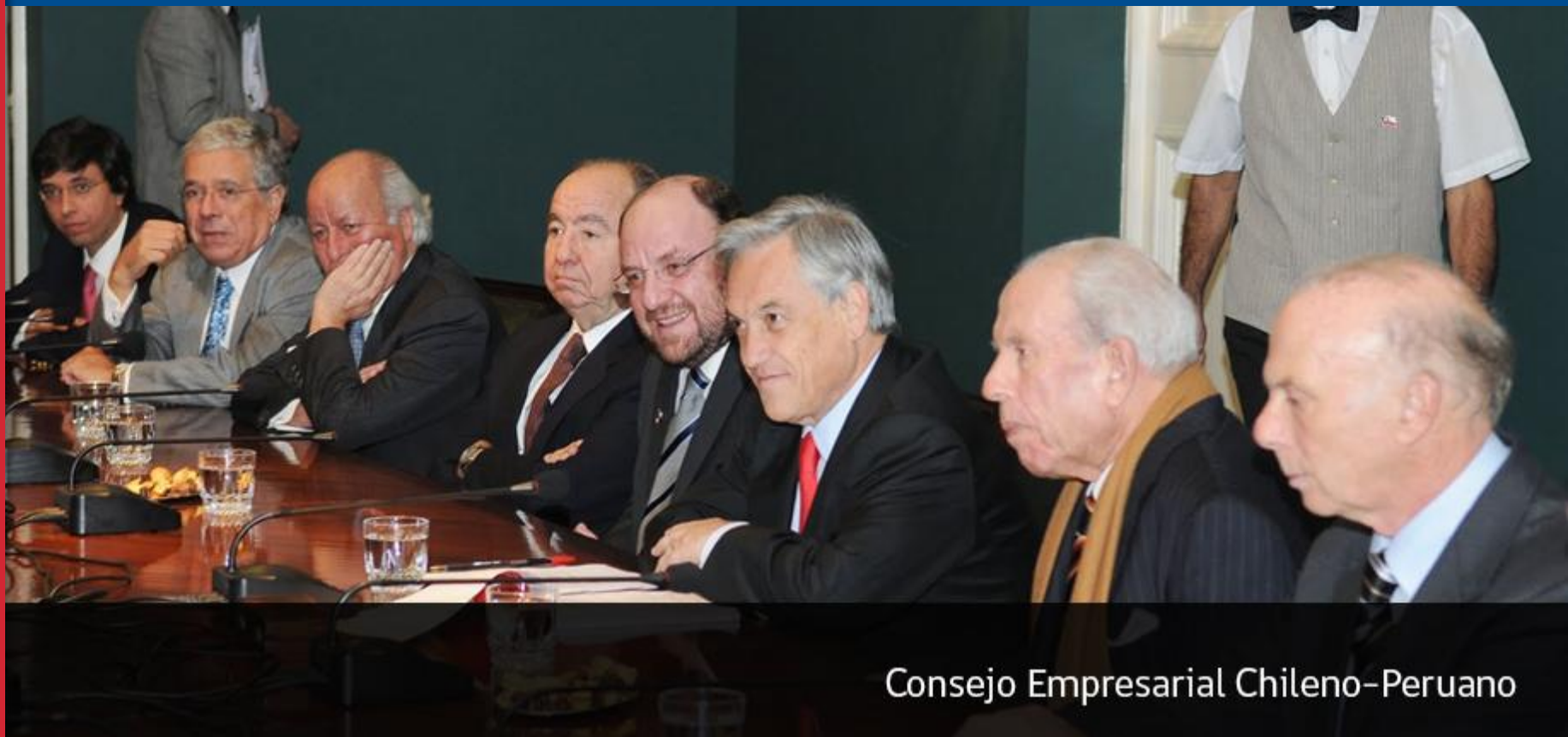
Consejo Empresarial Chileno-Peruano