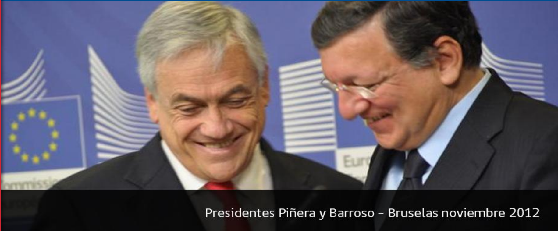
Presidentes Piñera y Barroso – Bruselas noviembre 2012