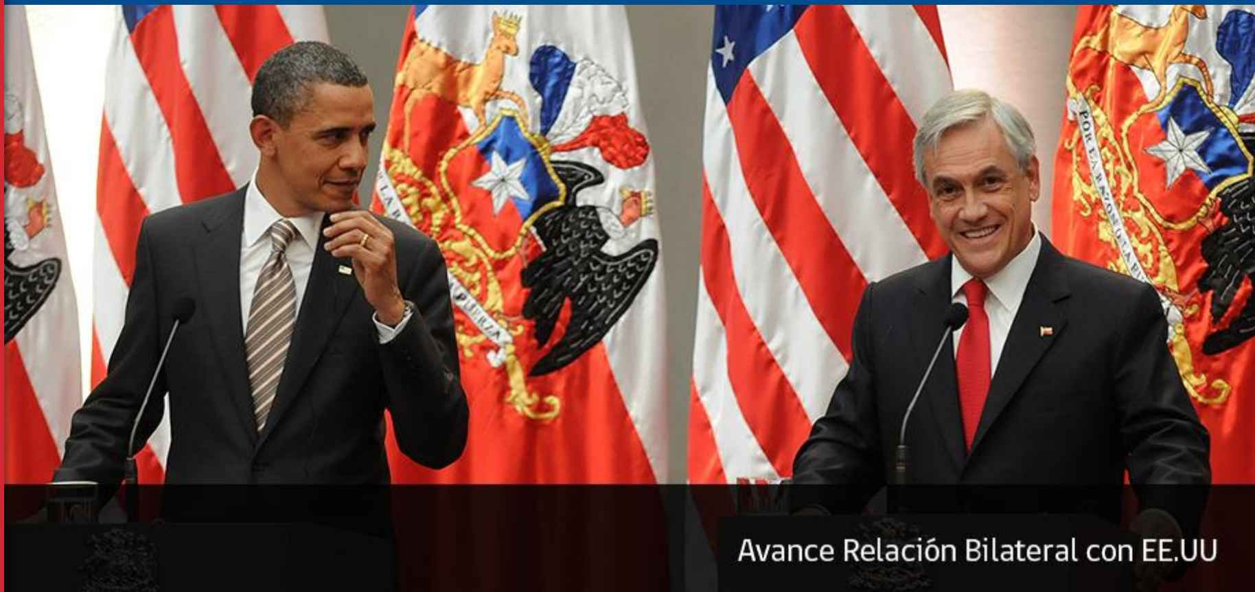
Avance Relación Bilateral con EE.UU