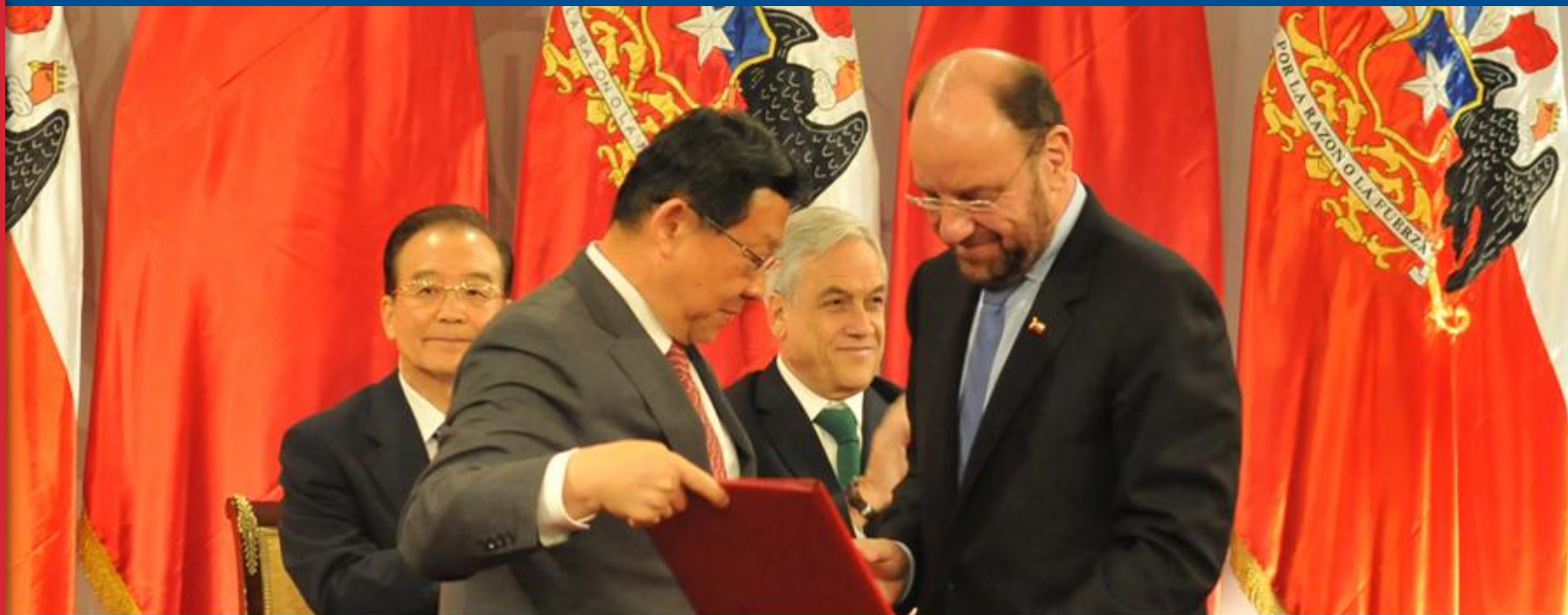
Visita Primer Ministro Chino