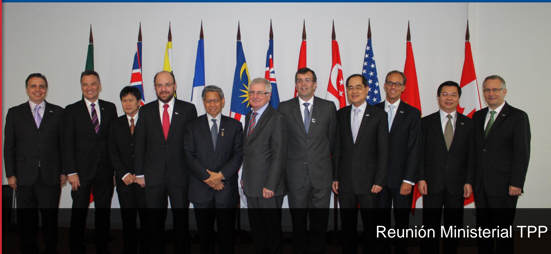
Reunión Ministerial TPP