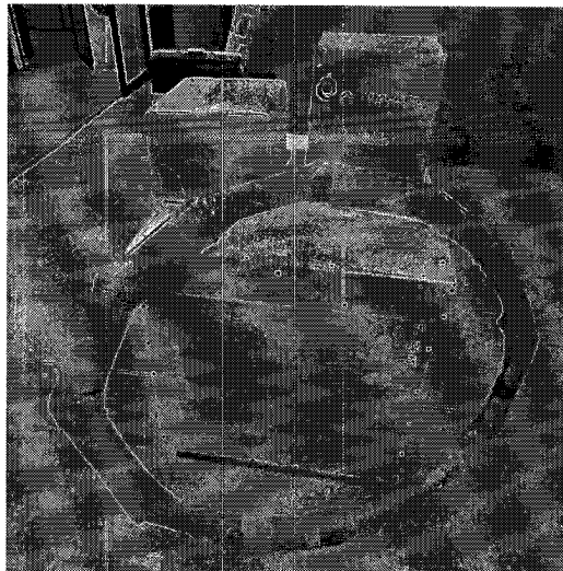
Figura 1: Ejemplo de embalaje de TNT.