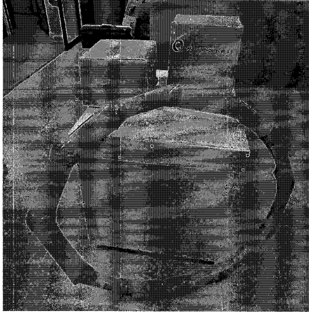
Figura 1: Ejemplo de embalaje de TNT.