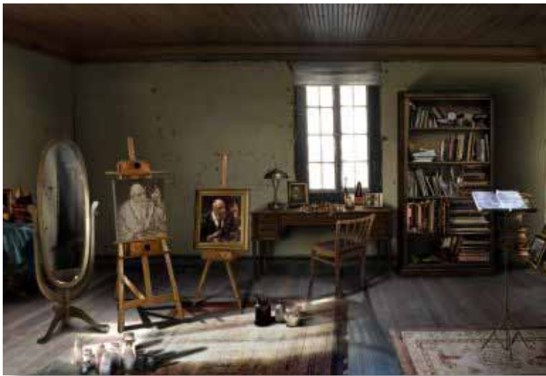
La lección de pintura